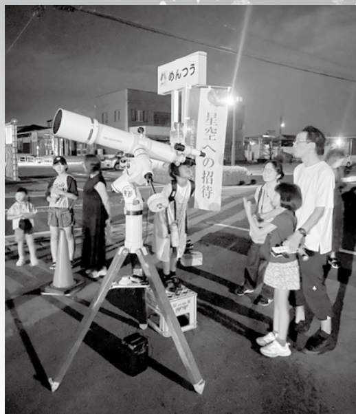
▲〈かわらティエ〉駐車場にて