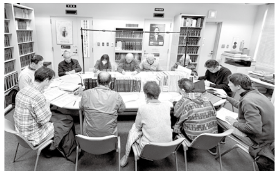
▲第6回設立発起人会（於吉田東伍記念博物館）