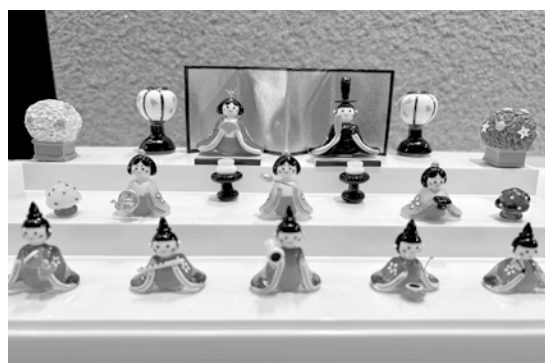
ミニチュアコレクションの「ひなまつり」展示